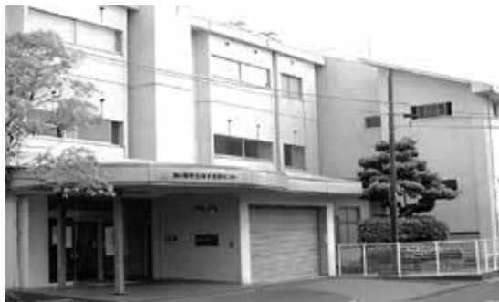
総合教育センター