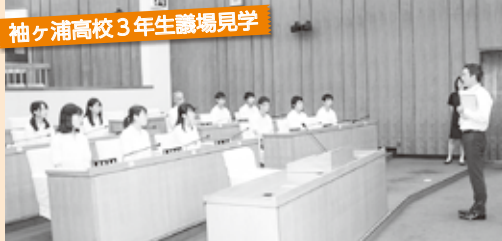
袖ヶ浦高校3年生議場見学