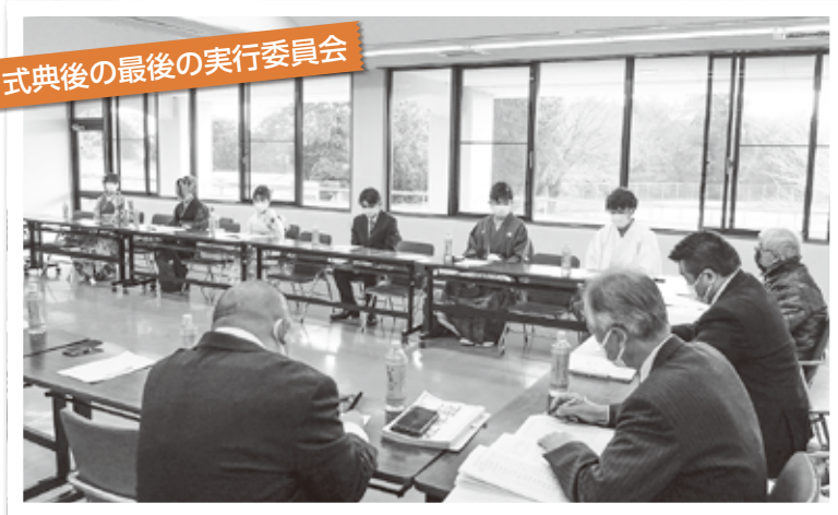
式典後の最後の実行委員会