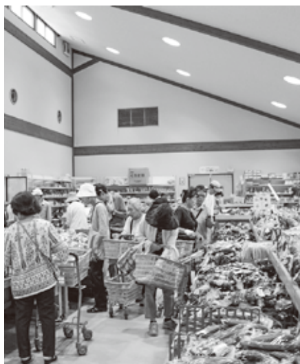
新鮮野菜であふれた活気ある売り場

A 身近な消費者に地域で生産される新鮮で安全な農畜産物を提供するとともに地産地消の推進・農家経営の安定的発展と地域農業の振興に資することをコンセプトとしています。