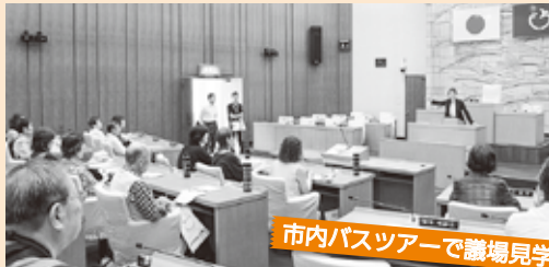
市内バスツアーで議場見学